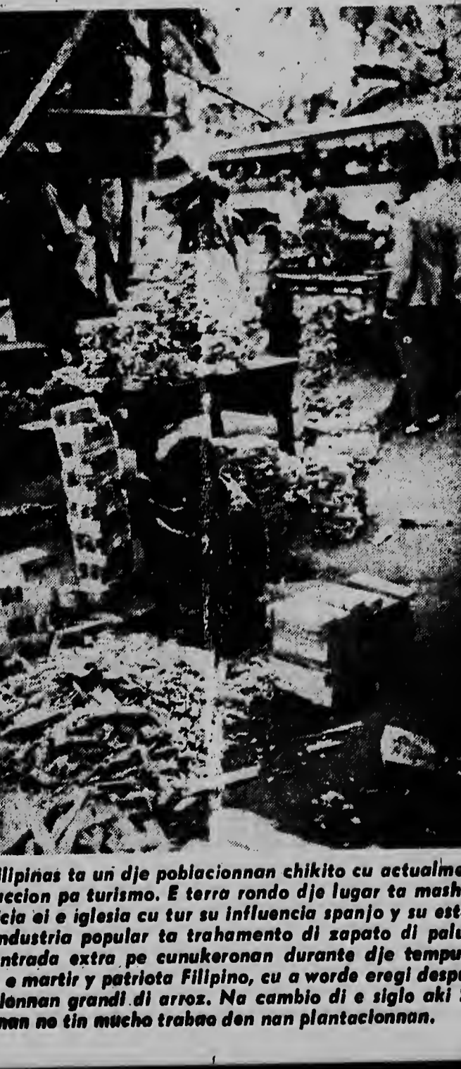
Ligao na Filipinas ta un dje poblacionnan chikito cu actualmente masha atracion pa turismo. E terra rondo dje lugar ta masha ta njan a edifica el e iglesia cu tur su influencia spanjo y su estatuto. Ligao un industria popular ta trahamento di zapato di palu cu trae un entrada extra pe cuukeronan durante dje tempunan. Jose Rizal, e martir y patriota Filipino, cu a worde erigi despues, cu plantacionnan grandi di arroz. Na cambio di e siglo aki Spanjan no tin mucho trabao den nan plantacionnan.